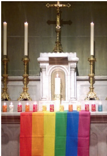
Segensfeier für Homosexuelle in einer Berner Kirche.

Denn «vom Segen Gottes ist niemand ausgeschlossen». An der bisherigen Praxis im Bistum Basel werde sich daher nichts ändern. Theologie und Seelsorge müssten sich jedoch in diesem Bereich weiterentwickeln.