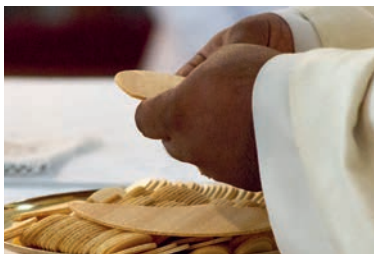
Auch Hörbehinderte können anderen Menschen die Kommunion nach Hause bringen.

Do, 20.5., 13.30 Uhr bis 16.30 Uhr, via Zoom | Kosten: Professionelle Mitarbeitende: 120.- Fr., Freiwillige: 60.- Fr. | Anmeldung bis 2.5. an s.gisler@caritas-luzern.ch oder 041 368 51 31 | Weitere Infos: caritas-luzern.ch → was wir tun → Diakonie → Bildungsangebot