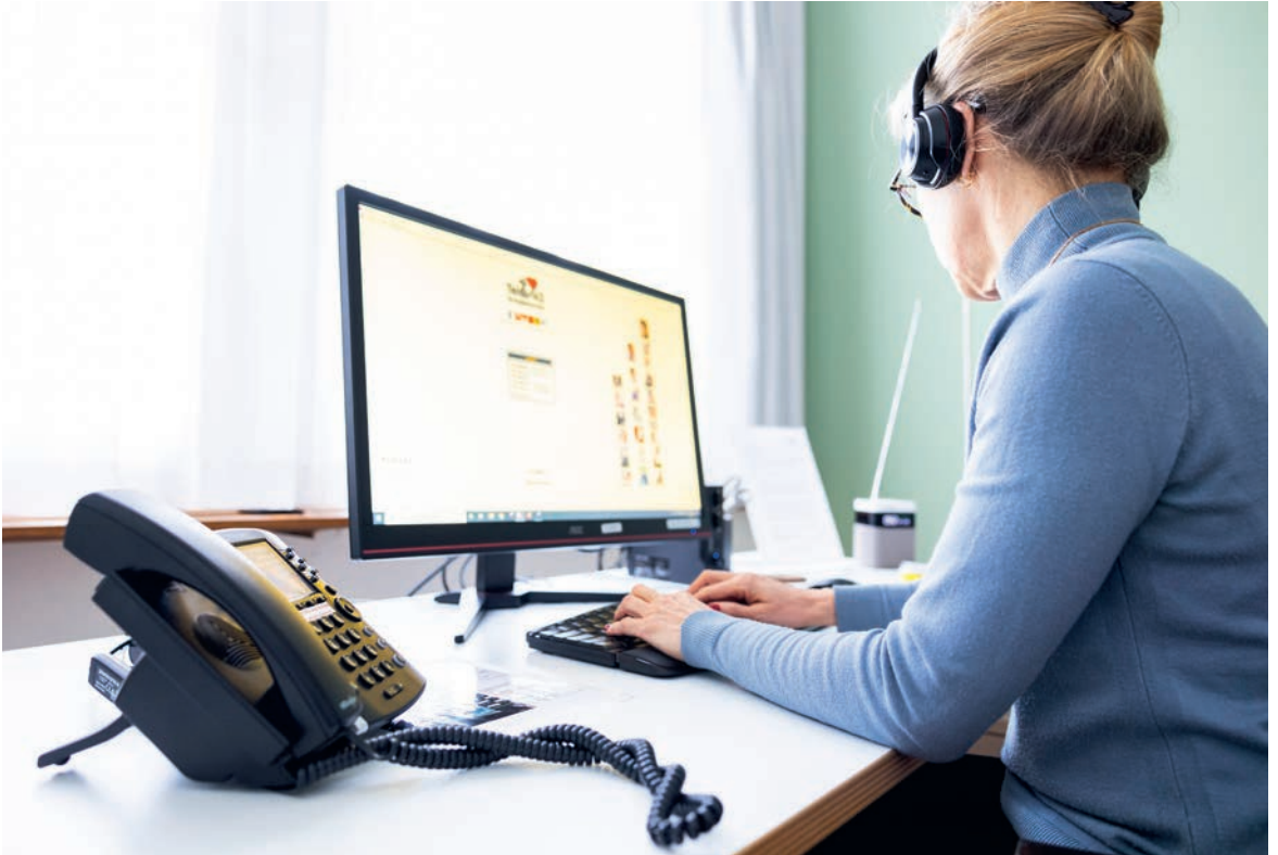
Eine Mitarbeiterin von «Die Dargebotene Hand» Zentralschweiz am Telefon. «Was viele Anrufende zurzeit bewältigen müssen, ist oft sehr schwer», sagt Geschäftsleiter Klaus Rüttschi.

Hand» eben gerade nicht eingreift und die Anonymität der Betroffenen wahrt? «Dies erachten viele gerade als Vorteil», sagt Rüttschi, «wir schalten nicht gleich die Polizei oder sonst eine Stelle ein.» Damit aber bleiben doch auch viele in ihrer Not zurück? «Um Gottes Willen, nein» entgegnet er, «sonst bräuchte es uns nicht. Wir haben eine Haltung.»