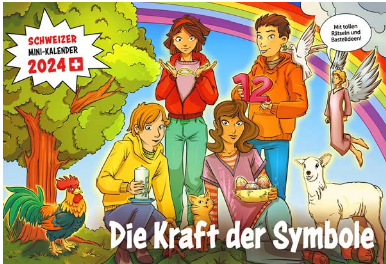
Der Mini-Kalender 24 vermittelt Wissen über religiöse Symbole.

Mo, 27.11., 18.15, Universität Luzern, Hörsaal 1.