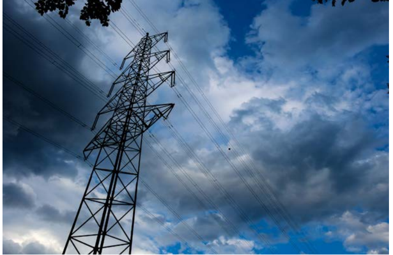
Es könne «nicht mehr bezweifelt werden», dass der Ursprung des Klimawandels menschengemacht sei, schreibt Papst Franziskus.

Ausführlich spricht der Papst in dem Dokument, das als «Fortsetzung» seiner Umweltenzyklika «Laudato si»